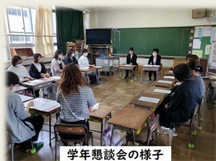
学年懇談会の様子